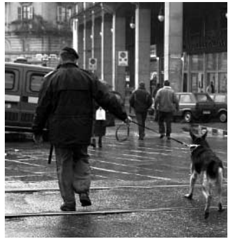
CONTROLLI Agenti di polizia

Gli agenti di Polizia, con unità cinofile, hanno effettuato numerosi controlli all'interno e all'esterno degli istituti superiori della città