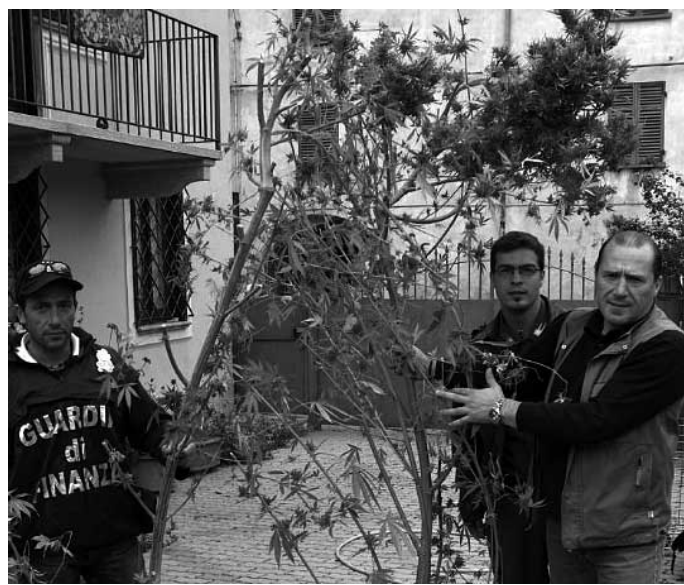
IN SERRA Le due piante di marijuana sequestrate dalla Guardia di Finanza