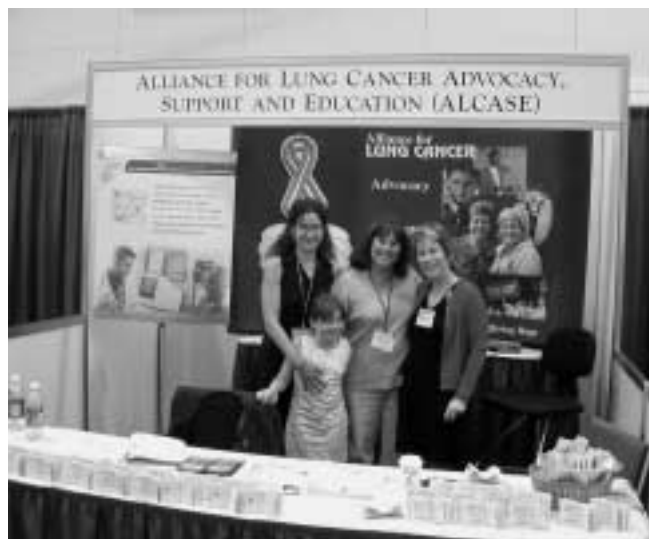
Stand dell'ALCASE statunitense al Congresso di Vancouver

Al momento, bisogna accettare il fatto che non siamo ancora giunti alla rivoluzione terapeutica che si sperava ma che rimane,